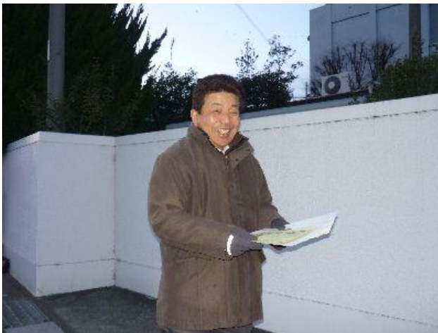
(高崎地区労会議・小野里議長も参加)