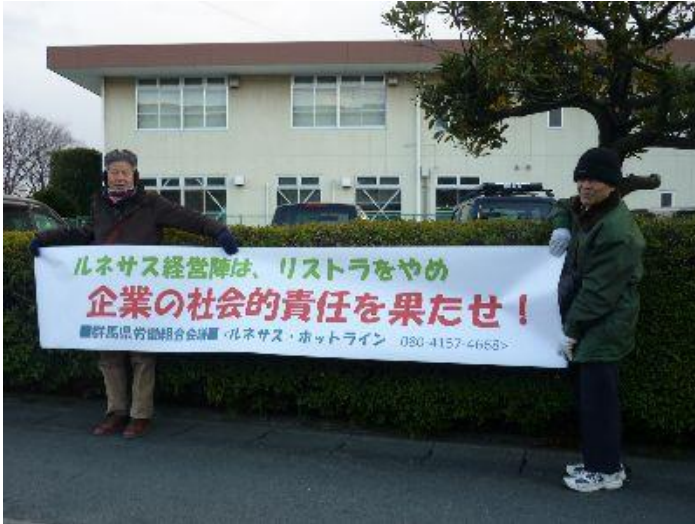
(バスに乗った労働者も見ていった横断幕)