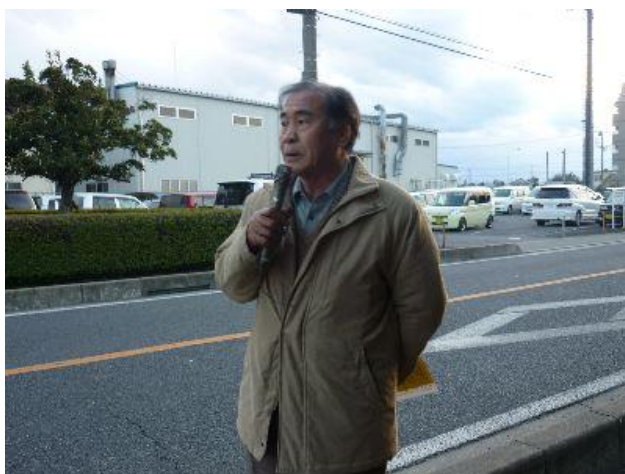
（県労会議・真砂議長の説得力のある訴え）